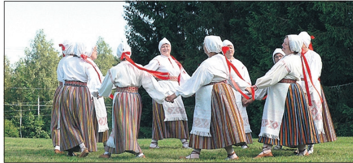
Memmede rühm Õhakanupp esinemas Liivi muuseumis Kodavere kihelkonna kiigepeol.

"Õhakanupu" on praegu 14 "nuppu", neist 7 on koos tantsinud kõik need 10 aastat. Nende aastate jooksul on koos käidud nii proovides kui ka esinemistel kokku 415 korda, esinetud 68 korral. Traditsioonilised esine-